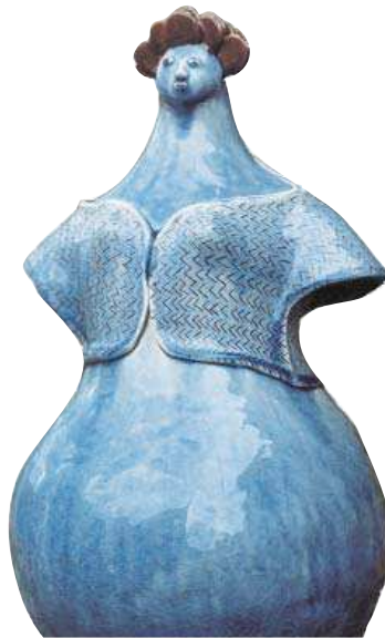
Poterie réalisée par M. Nigon

Continuer par la route sur 1,5 km environ jusqu'au Déroit. Au carrefour (6), tourner à droite et longer la D1. A la sortie du Déroit, prendre le 1 er sentier à gauche. Suivre ce chemin sur 1,5 km jusqu'au cimetière de Savignies (7). Traverser la route et prendre le chemin d'en face. Au bout de celui-ci, tourner à droite jusqu'à la route (8). Tourner à droite et prendre ensuite la 1 ère rue à droite en direction de la mairie, puis revenir vers l'église.