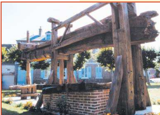
Pressoir à cidre

Au niveau du point 4, prendre le sentier de gauche et le suivre jusqu'à la route (A). Prendre le chemin en face et continuer en longeant une prairie. Au carrefour, continuer tout droit sur le sentier principal. A la prochaine bifurcation (B), prendre le sentier descendant à droite. Prendre le second sentier sur la droite. En bas du chemin, continuer tout droit et emprunter la route. Au carrefour, tourner à gauche et prendre ensuite à droite (C) la rue du Fond Pierre Tain. A l'intersection suivante, continuer tout droit jusqu'à Armentières. Au croisement (D), tourner à droite, puis prendre la prochaine route sur la gauche. Au carrefour (E), tourner à droite puis à nouveau à droite au 1 er chemin de terre qui monte. Arrivé en haut (4), tourner à gauche et continuer sur ce chemin jusqu'à la route. Reprendre le descriptif au numéro 5 pour rejoindre Savignies.