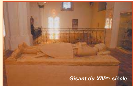
Gisant du XIII ème siècle

l'appartenance de cœur à la Normandie. Enfin, le plat de la passion du Christ siège en bonne place dans la salle du conseil municipal comme le dernier témoin d'une tradition ancestrale de poterie et de céramique décorative et utilitaire.